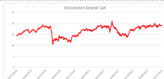
Grafico Performance (5 anni)

Sottostanti: Assicurazioni Generali SpA, Intesa Sanpaolo SpA, Poste Italiane SpA