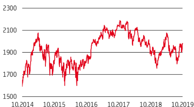
Grafico a 5 anni

Si avverte l'investitore che l'andamento storico dell'indice non è necessariamente indicativo del futuro andamento del medesimo.