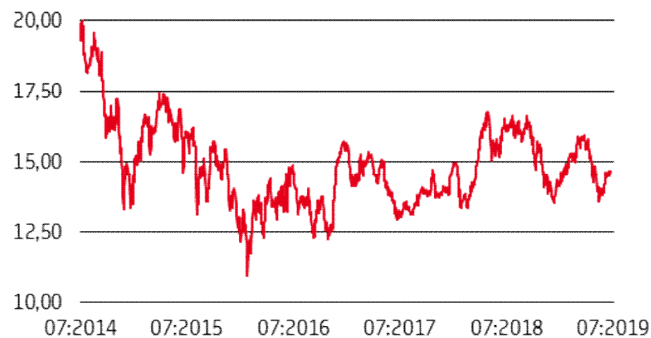
Eni S.p.A.: grafico a 5 anni

Si avverte l'investitore che l'andamento storico dell'azione non è necessariamente indicativo del futuro andamento del medesimo.