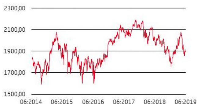
Grafico a 5 anni

Si avverte l'investitore che l'andamento storico dell'indice non è necessariamente indicativo del futuro andamento del medesimo.