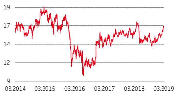
Grafico a 5 anni

Si avverte l'investitore che l'andamento storico dell'azione non è necessariamente indicativo del futuro andamento della medesima.