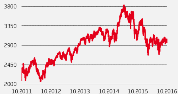
EUROSTOXX50 INDEX: GRAFICO A 5 ANNI

Grafico: fonte Thomson Reuters. I dati storici non sono necessariamente indicativi delle eventuali performance future dell'indice.