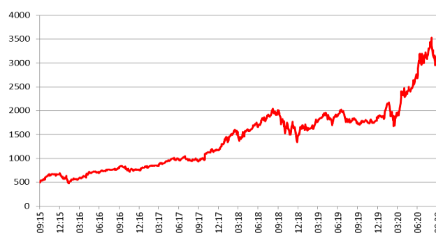
Grafico a 5 anni

Si avverte l'investitore che l'andamento storico dell'azione non è necessariamente indicativo del futuro andamento della medesima.