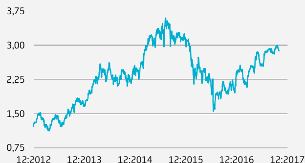
AZIONE INTESA SANPAOLO S.P.A.: GRAFICO A 5 ANNI

Si avverte l'investitore che l'andamento storico dell'azione non è necessariamente indicativo del futuro andamento della medesima.