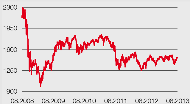
Grafico: fonte Thomson Reuters